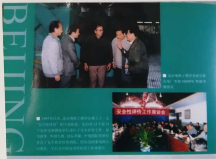
■ 北京电机工程学会在泰山地区 2000 年 6 月 10 日 召开安全性评价工作座谈会