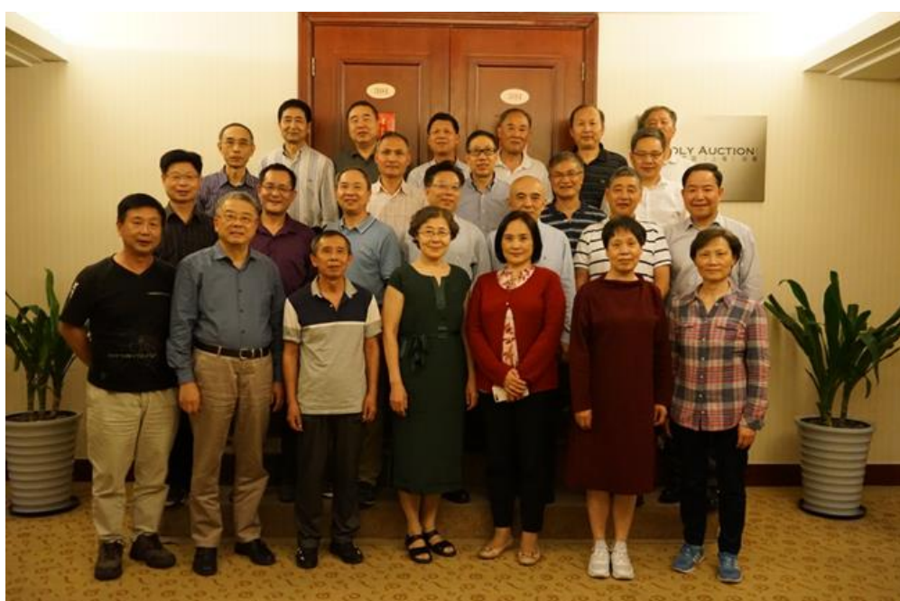
浙大电机77级庆祝入学四十周年同学聚会合影

2018年的五月，风暖昼长，麦已灌浆，水塘新荷，花丛蝶忙。在这个花未全开月未圆、一切都刚刚好的暖夏季节，浙大电机77级的25位同学于5月24日在上海聚会，庆祝入学四十周年(1978-2018)。